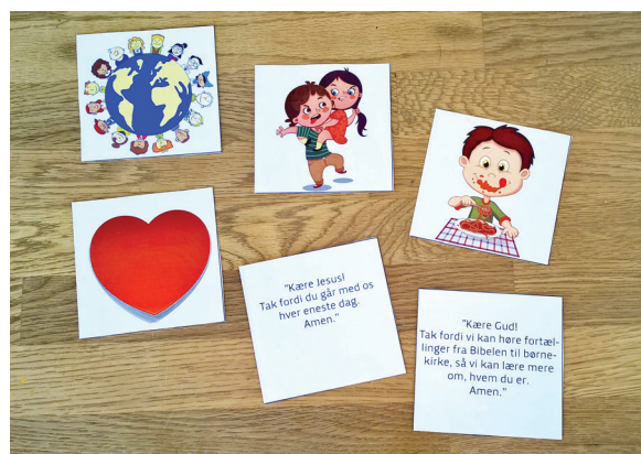
Eksempel på bedekort

Se forslag til seks tegninger og bønner på næste side.